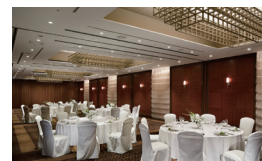
プライベートバンケット「肥後」 Private Banquet Hall HIGO