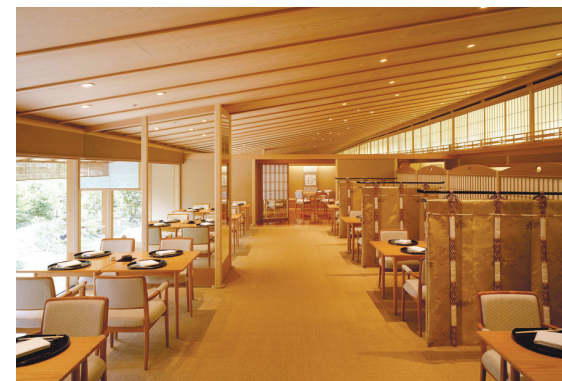
日本料理「弁慶」 / Japanese Restaurant Benkay

気軽なティータイムから本格的なディナーまで、 さまざまなシーンを多彩に楽しめるレストランとラウンジ。