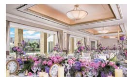
ガーデンバンケット「Sora」 Garden Banquet Hall Sora