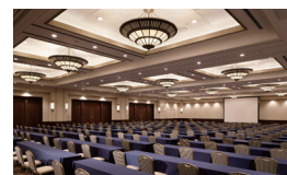
中宴会場「天草」 Banquet Hall AMAKUSA