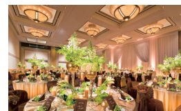
大宴会場「阿蘇」 Banquet Hall ASO