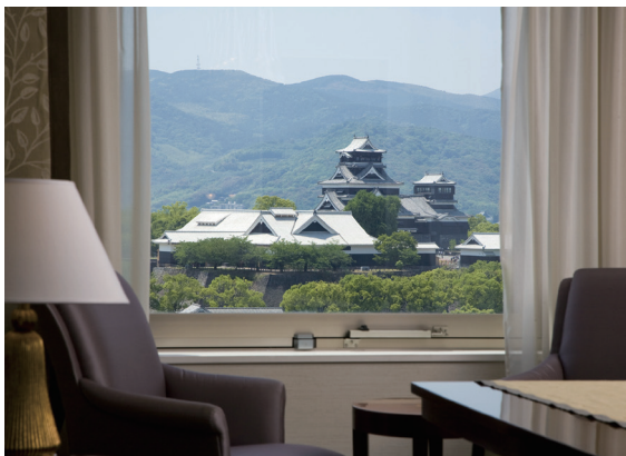
客室から見た熊本城 / Guest room with view of Kumamoto Castle