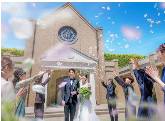
チャペルガーデン / Chapel Garden