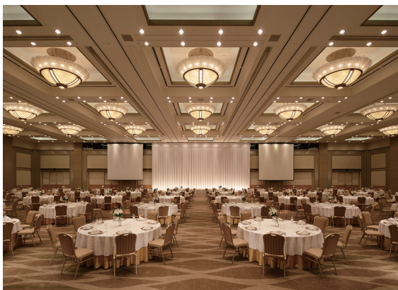
大宴会場「阿蘇」 / Banquet Hall ASO